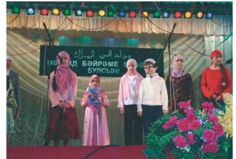
Маулид-байрам, г. Челябинск