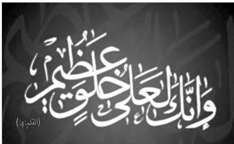
ПОДЛИННО У ТЕБЯ НАИЛУЧШИЙ ПРАВ

Пророк (салляллаху алейхи ва саллям) наставлял мусульман, чтобы они толковали свои сны только к лучшему: «Сны бывают трех видов. Первый - благая весть от Аллаха. Второй - наущения нафса. Третий - наваждение от шайтана, страх, который он насыляет на человека. Если кто-либо видел хороший сон, пусть расскажет его. Если же видел страшный сон, пусть никому об этом не рассказывает, а встанет и прочитает намаз» (Ибн Маджа, Та'бир, 3). Все намерения и желания человека - в какой-то степени дуа, просьбы, обращенные к Всевышнему. По этой причине размышления о благом, созерцание благого приносят человеку покой, вселяют в него умиротворение. Благие мысли влияют на происходящие события, направляя их в положительное русло.