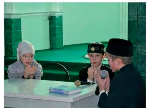
Маулид-байрам, г. Самара

Уважаемые читатели! Отнеситесь с почтением к газете, не используйте ее в недостойных целях, ибо в ней упоминается имя Создателя. За добро Ваших сердец воздастся Вам добром.