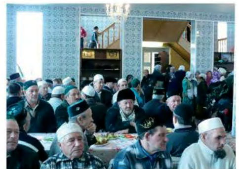
Маулид-байрам в мечети «Ускудар» (Мордовия)