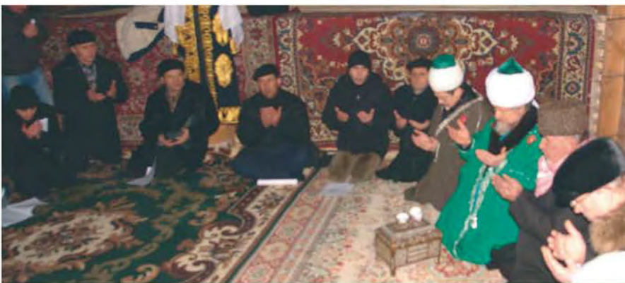
Молитва в мечети "25 Пророков" г.Уфа

По сегодняшний день эта священная реликвия сохраняется в исторической резиденции ЦДУМ России, торжественно выносятся во время празднования Маулид Шарифа, открытия новых мечетей и во время ежегодных торжеств «Изге Болгар шокер жиены» в Древних Булгарах, посвященных Дню добровольного принятия светоча Ислама нашими предками – булгарами.